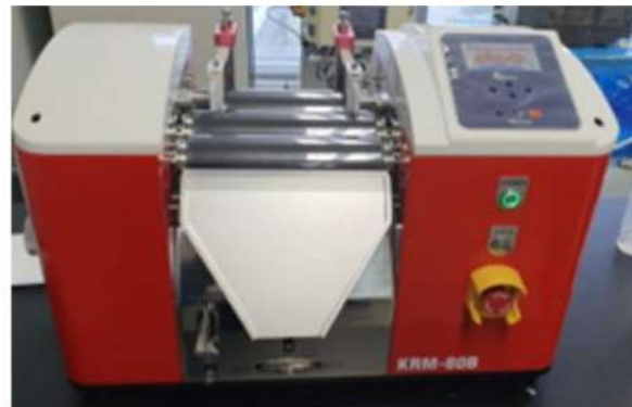
Three roll mill