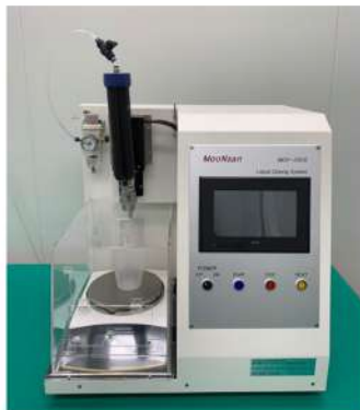
Liquid Dosing System