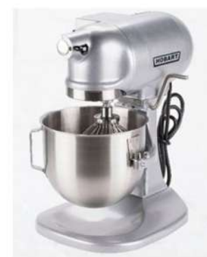
Hobart Mixer 5L, 20l