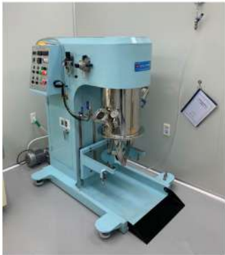
Planetary Mixer 200L, 20l